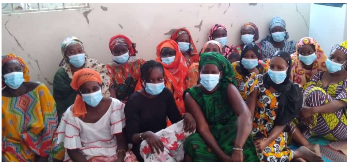
Ilustración 4. Grupo focal de la evaluación final - comuna de Diokoul

El proyecto integró la perspectiva de género de manera transversal en sus tres componentes, desde la formulación, operativa y evaluación. La intervención tiene una fuerte centralidad en promover los derechos de las mujeres, como eje principal alrededor del cual se vertebran y complementan sus tres resultados.