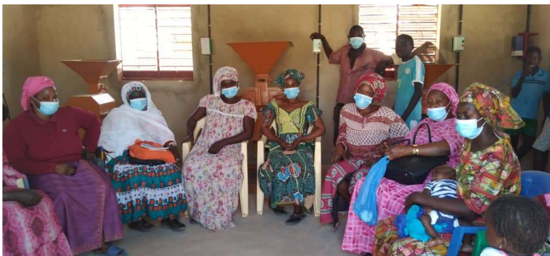
Ilustración 3. Grupo focal de la evaluación- comuna de Sagatta