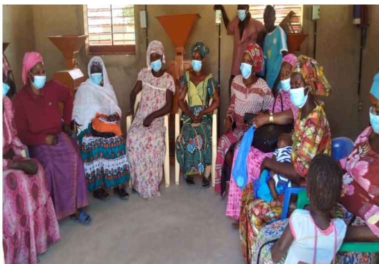
Ilustración 5. Grupo focal de la evaluación final- Comuna de Bandagne

Las acciones planteadas por el proyecto tienen un fuerte enfoque de Derechos, que es su núcleo vertebrador a partir del cual se articulan y complementan sus tres componentes, en un contexto donde históricamente las mujeres han sufrido la vulneración de sus derechos básicos. Según el reporte de Amnistía Internacional 2021, la situación de vulneración de los Derechos Humanos en el país es realmente preocupante.