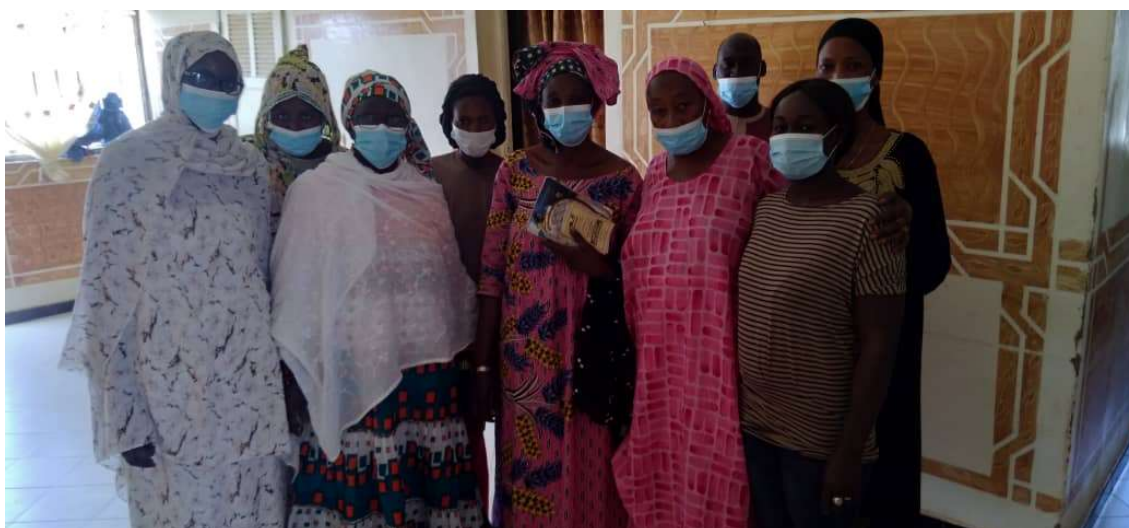
Ilustración 2. Grupo focal de la evaluación- Lideresas

Los procesos que FADEC y NE-SI impulsan en Kebemer son de largo aliento, y la actual intervención da continuidad al proceso de fortalecimiento de las estructuras organizativas locales iniciados en anteriores intervenciones. Es el caso de la Red de Mujeres Activistas de Kébémér