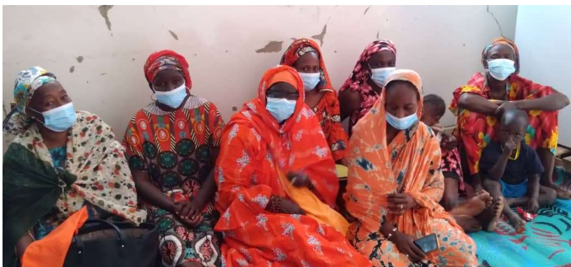
Ilustración 1. Grupo focal de la evaluación- comunidad Diawar ( Ngourane )

El proyecto ha logrado una alta participación en sus diferentes fases de los grupos meta priorizados y los actores institucionales, organizaciones y población de las comunas focalizadas del departamento de Kebemer. En cuanto a la calidad de la participación, en términos generales las acciones desarrolladas han logrado captar la motivación de participación de los grupos meta, de las autoridades de Kebemer, de las instituciones públicas y el liderazgo comunitario , que aportaron ideas, y asumieron compromisos con procesos clave como los impulsados con el Resultado 2, que han fortalecido la institucionalización del marco normativo para la prevención y atención de las violencias de género y otras vulneraciones que afectan a las mujeres del país, sin la participación de todo el conjunto de actores locales hubiera sido imposible sacar adelante el Plan Departamental de Prevención de las violencias basadas en el género. En general, las acciones implementadas han potenciado la participación de las mujeres en espacios de toma de decisiones a nivel departamental, institucionalizándose su reconocimiento como actoras sociales con derechos a opinar y decidir sobre los recursos públicos, procesos que requieren seguirse apoyándose hasta que las mujeres logren un nivel de empoderamiento que garantice esta participación sin ayuda externa.